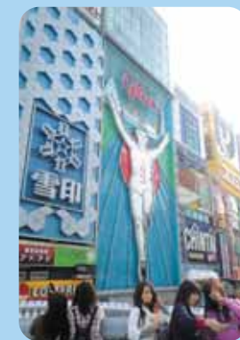
戎橋 戎橋のある難波・心斎橋の界隈は、関西でもっとも有名な繁華街のひとつ。「ミナミ」と呼ばれるこのエリアは、日夜、老若男女でにぎわっています。