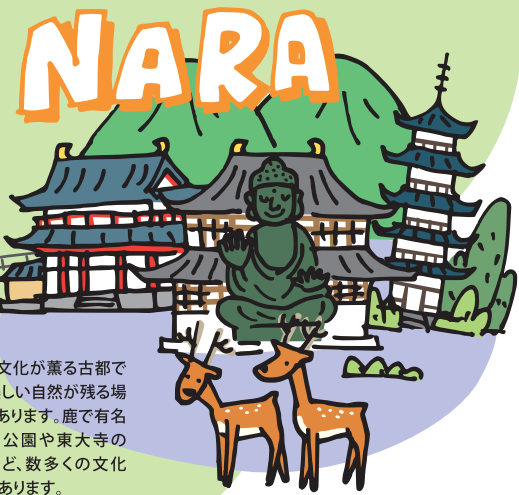
歴史と文化が薫る古都であり、美しい自然が残る場所でもあります。鹿で有名な奈良公園や東大寺の大仏など、数多くの文化遺産があります。