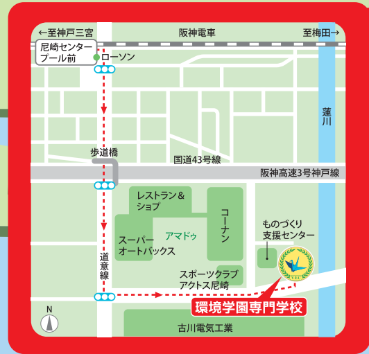
阪神電車「尼崎センタープール前」から 徒歩 8分