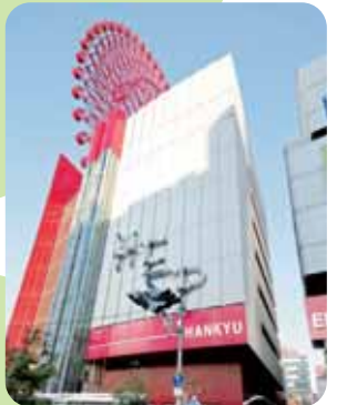
HEP FIVE 観覧車 阪急梅田駅にあるファッションビル「HEP FIVE」の屋上には、巨大ホイールが遠くからでも目を引く観覧車があります。