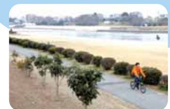
武庫川河川敷公園 兵庫県の名所の武庫川河川敷公園も学校から近い場所に。快適なジョギングコースとして利用する学生もたくさんいます。