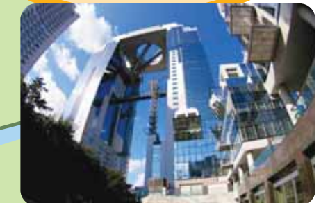
梅田スカイビル 2棟のビルが繋がった大阪のランドマーク。最上層には大阪の街を一望できる空中庭園展望台があり、絶好の夜景スポットです。