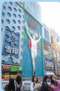
戎橋 戎橋のある難波・心斎橋の界隈は、関西でもっとも有名な繁華街のひとつ。「ミナミ」と呼ばれるこのエリアは、日夜、老若男女でにぎわっています。