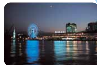
神戸ハーバーランド デパートやショッピングモール「モザイク」、遊園地などが集まった神戸ハーバーランドは、夜景も見事な人気エリアです。