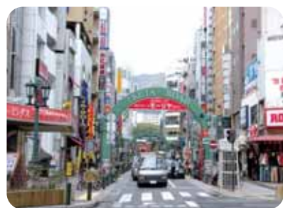
三宮 神戸エリアのターミナル駅三宮周辺は、百貨店からマルイやミント神戸、飲食店まで多彩なお店がひしめく大繁華街です。