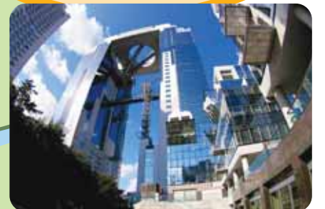
梅田スカイビル 2棟のビルが繋がった大阪のランドマーク。最上階には大阪の街を一望できる空中庭園展望台があり、絶好の夜景スポットです。