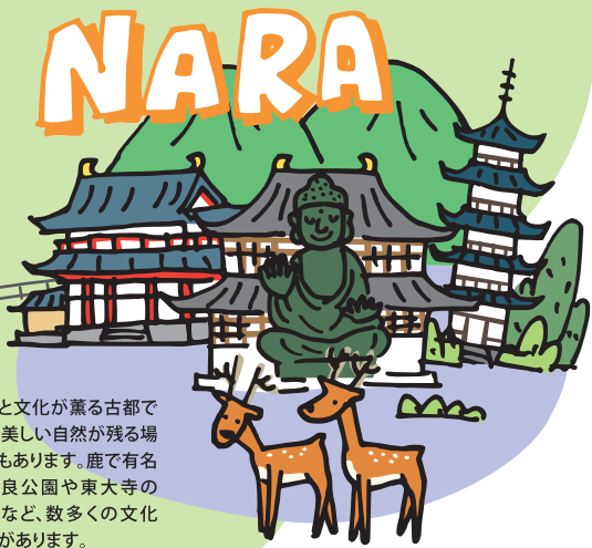
歴史と文化が薫る古都であり、美しい自然が残る場所でもあります。鹿で有名な奈良公園や東大寺の大仏など、数多くの文化遺産があります。