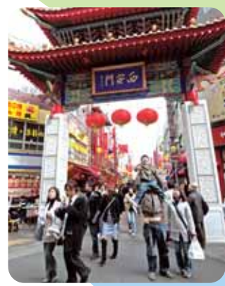
南京町 本場さながらの中国料理店や雑貨店がぎっしり並ぶ日本有数のチャイナタウン。活気に満ちた中華街の雰囲気を楽しめます。